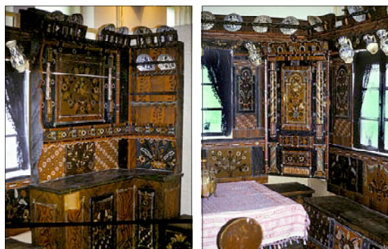
Sepsiszentgyörgy, Székely Nemzeti Múzeum: csángó szoba; menyasszony lakodalmos szekere