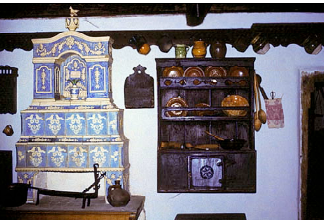
Sepsiszentgyörgy: csempekaláya és falitka a Székely Nemzeti Múzeumban

Háromszéket (Trei-Scaune, Drei Stühle) délen a Barcaság, keleten a Bodzafordulói-hegység, északon az Olt völgye, nyugaton a Baróti-hegység határolja, a Rétyi-szoros pedig Alsó- és Felső-Háromszékre tagolja. Bővelkedik festői tájakban, borvízforrásokban, építészeti emlékekben.